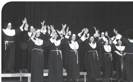
Showvorführung des Vorstandsorden an der 90. GV

Der Verein für Familienhilfe bietet nun auch einen Mahlzeitendienst an. Nach 21 Jahre trennte man sich im Jahr 2000 von den Holzbearbeitungs-