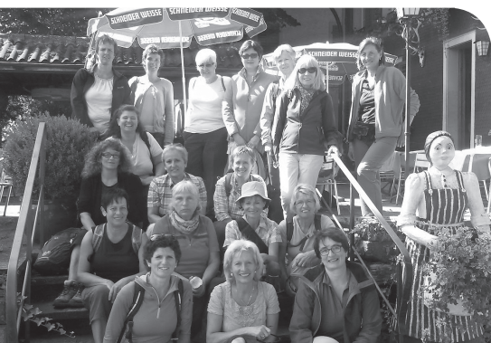
sportlich unterwegs - gemeinsamer Anlass mit anderen Frauervereinen rund um den Sempachersee