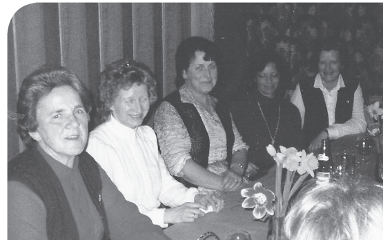
Die neue Zusammensetzung des Vorstandes 1983 - 1. Teil