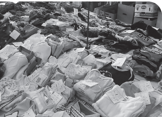
Kinderartikel und Kleiderbörse im Pfarreiheim