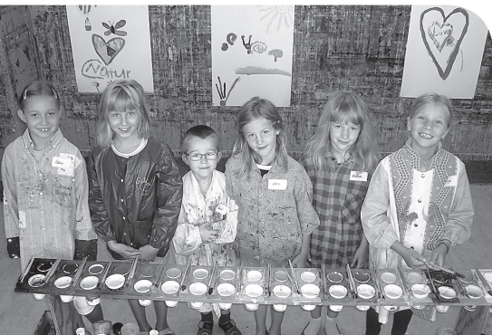
Ausdrucksmalen im Mal-Atelier