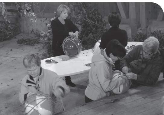
Nielenkurs im November 2014