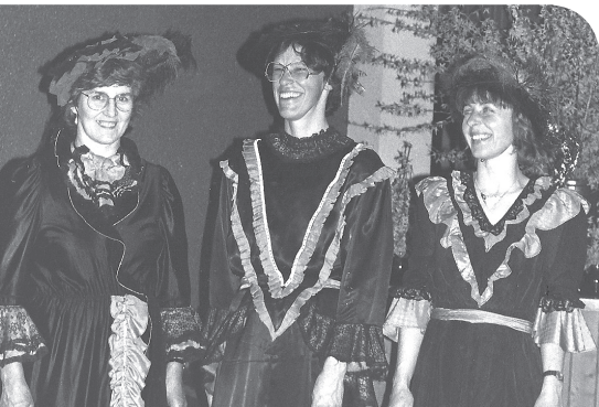
Anlass zum festlich feiern - 75 Jahre Frauenbund Neuenkirch

der Kilbi 1990 und am Bazar für die Kirchenrenovation anfangs Oktober 1991 wurde der Frauenbund wiederum stark eingebunden. Das Kursprogramm wurde all die Jahre sehr abwechslungsreich gestaltet. Die absoluten Renner waren allerdings der Krippenfigurenkurs und der alljährliche Holzbearbeitungskurs. Jahrzehnte wurden beide Kurse angeboten. Die Vorträge der Erwachsenenbildung wurden in den Neunzigerjahre gemeinsam mit dem Gemeinnützigen Frauenverein, dem Pfarreirat sowie der Schulpflege und der Lehrerschaft durchgeführt. Einzug ins Kursprogramm erhielten nun auch die Informatikkurse. Im Jahr 1993 wurde unsere Aktuarin Marlis Dali in den SKF Luzern Vorstand als Pressefrau gewählt.