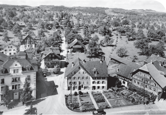
Neuenkirch um 1900