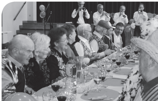
Seniorenfasnacht im Pfarreiheim - 2015